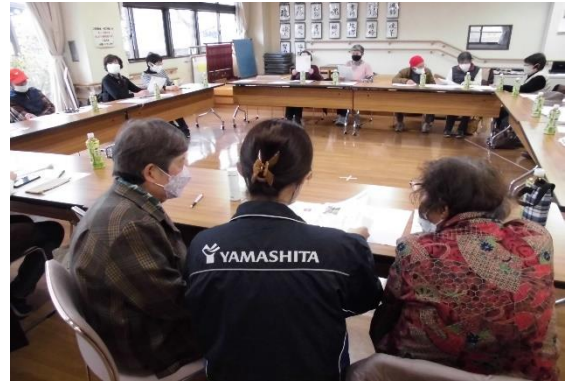
▲解析データに基づき、個別にアドバイス。「じっくり話を聴いてくれて嬉しかった」と好評でした。

このサロンでは、株式会社ヤマシタさんの他にも、さまざまな業種の民間企業が、さまざまな内容で地域貢献活動をしてきています。「こんなことしてくれる企業はないかな?」「町内サロンで役立つ講話をしてほしい」など地域のイベントなどで企業の協力をお願いしたい場合は、作野地区生活支援コーディネーター（作野福祉センター内：☎72-7570）にお尋ねください。