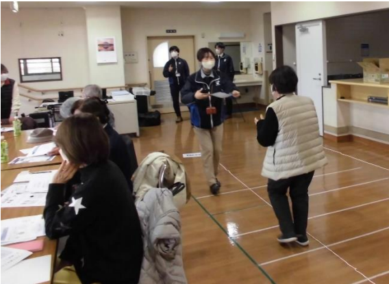
▲一人ずつ5m程歩き、歩く姿を撮影します。

作野地区社会福祉協議会は、奇数月の第2金曜日の午後に、ふくふくサロンを開催しています。1月13日(金)は、株式会社ヤマシタ豊田営業所にお越しいただき、「転倒防止のための歩き方講座～A | 解析で歩き方診断～」を行いました。当日は、過去最高の19名の参加があり、関心の高さがうかがえました。参加者は、一人ずつ歩き方を撮影し、解析してもらいました。参加者には、自分の歩き方のクセやオススメの運動トレーニングについて個別にアドバイスしてもらいました。