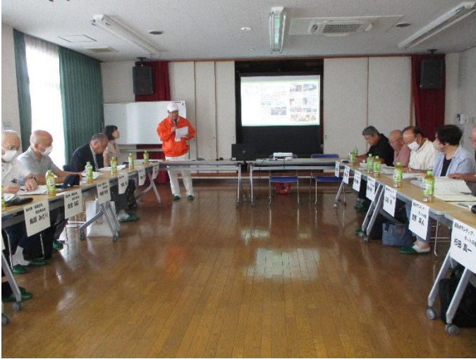
▲それぞれの会が活動報告をしました。