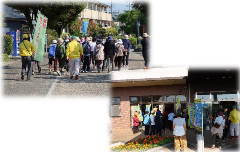
▲昨年も多くの方に参加頂きました！