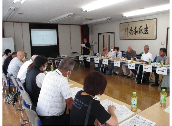
▲参加者同士で意見交換をしました。

8月28日（水）篠目町公民館にて、豊田市の若林自治区で積極的に生活支援活動をしている「若林お助け隊」と安城市篠目町にて同じく生活支援活動をしている「篠目ボランティア・ネットの会」の意見交換会（生活支援ネットワーク会議）が開催されました。会議では活動内容をお互いに紹介した後に、それぞれの活動に対しての質問や、抱えている課題について共有しました。同じ生活支援活動を行なう団体同士であっても“依頼がある経路”や“広報の方法”、“運営資金の出所”といった細かい部分には差異があり、両団体ともに今後の活動展開をしていくヒントを得ていました。また、今回の会議には生活支援活動に興味のある作野地区内の福祉委員の方にもご参加いただき、“自らの町内でもこのような活動ができないか検討する良い機会になった。”とのお声をいただきました。強みや弱みを認識し合える意義のある交流会となりました。