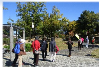
前回の様子（R3年10月実施）