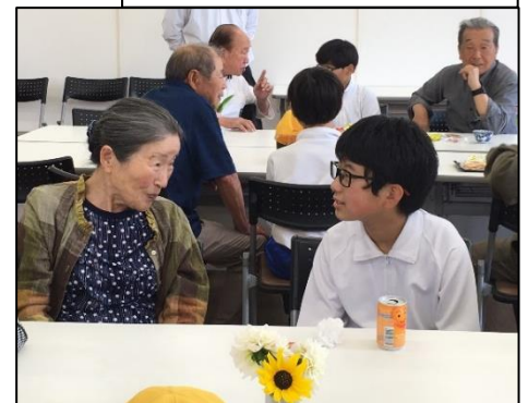
山崎町 にこにこサロン

新田連合町内会長を学校に招き、町の課題について聞き取り、活発な意見交換が行われました。その結果、町内行事の夏まつりで小学生がボランティア協力を行うことになりました。