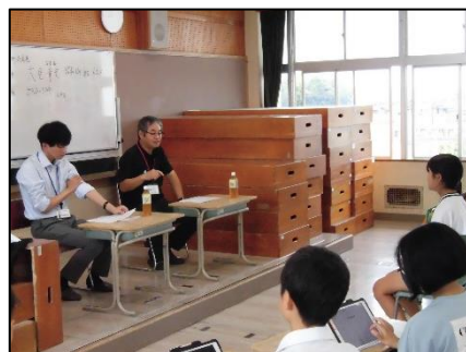
新田小 町内会長を招いての授業