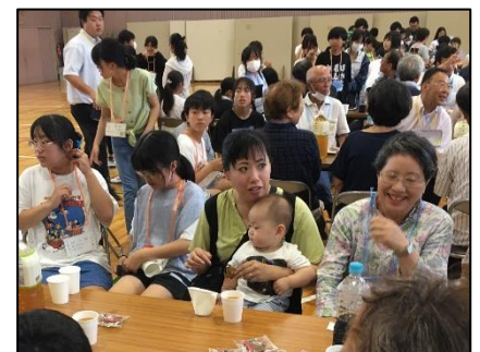
東部小 コミュニティサロン