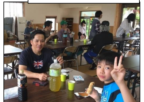
大岡町 わいわいサロン

各町内で子どもから高齢者まで、地域のつながりが持てるような取り組みが行われています。