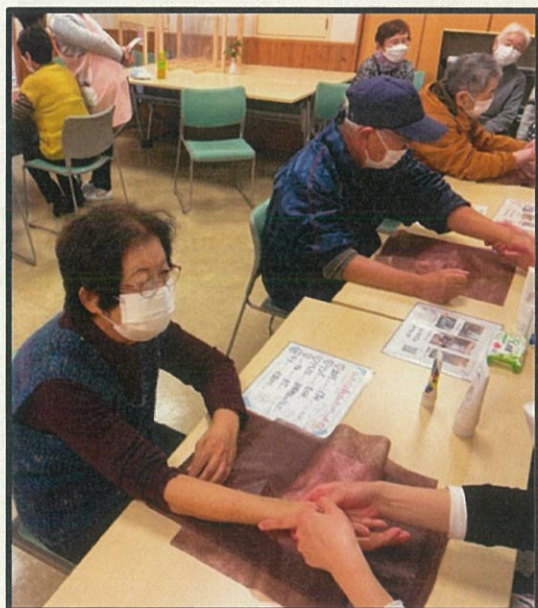
（ハンドマッサージの様子）

さっそくサロンで実施すると、「腕がとても軽くなった」「指がキレイになったから、孫に自慢してくるね！」「今まで経験したことがなかったが、マッサージがこんなにいいもんだとは驚いた」など、参加者に大好評でした。