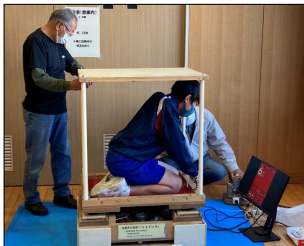
▲こなまず号で震度6を体験