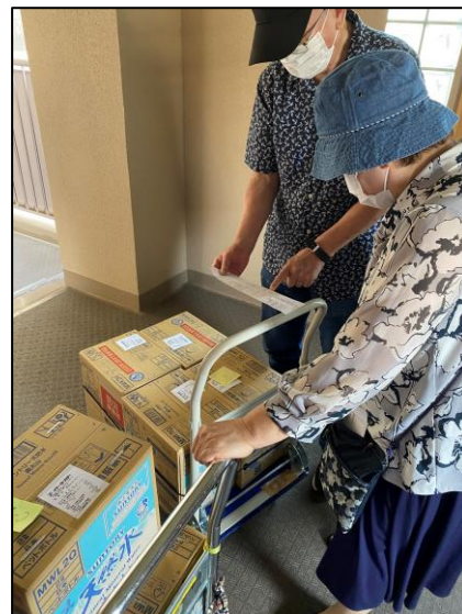
▲お届けしている様子

購入された方からは、「自分一人では重たくて運べないのでありがたい」、「自分たちの住むマンションでこういった取組があるのは助かる」といった声が聞かれました。