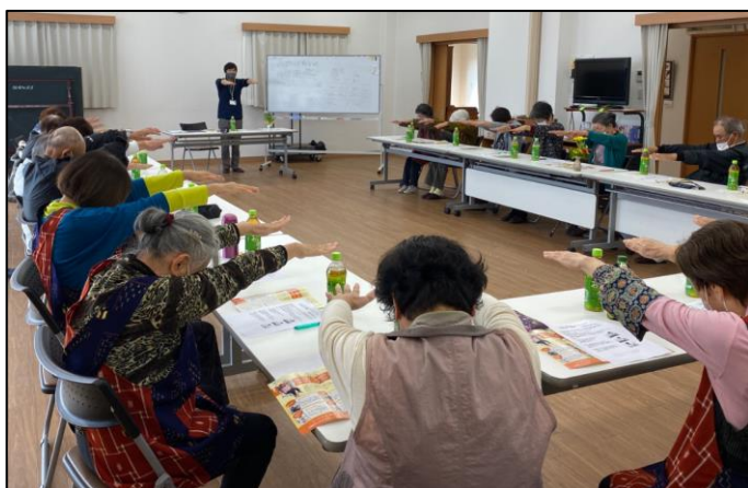
▲ストレッチを実際にやってみました！

参加された方からは、「簡単にできるので、自宅でも続けてやろうと思います」、「少しでも体を動かすことが大切だと知りました」という声が聞かれました。