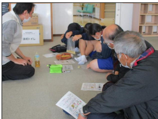
▲トイレ用凝固剤で液体が固まっていく様子を観察