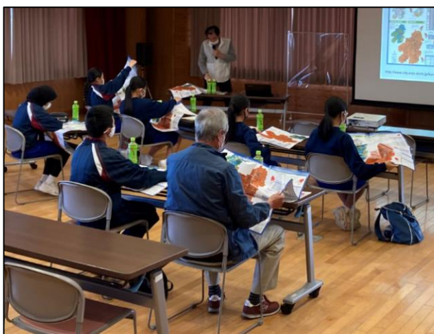
▲ハザードマップで住んでいる町の状況確認

また、交流タイムや体験を通して、地域のみなさんと地元中学生がつながる貴重な機会にもなりました。