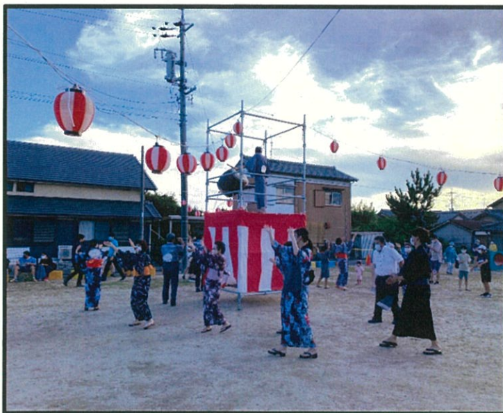
▲3年ぶりの盆踊り大会