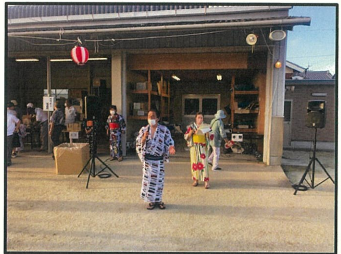
▲粋な浴衣姿の大見会長♪