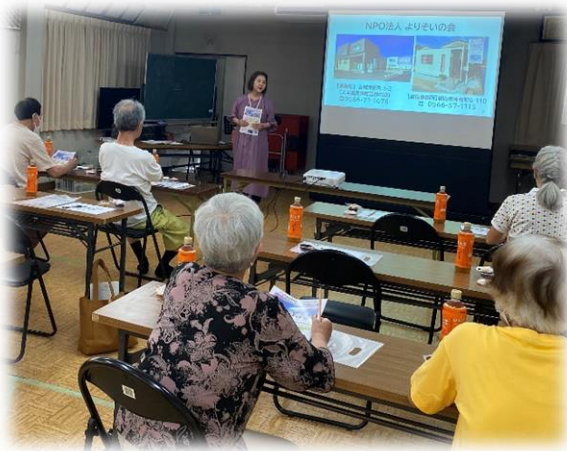
▲NPO 法人よりそいの会様の講話に 聞き入る地域住民のみなさん

宇頭茶屋町福祉委員会では、毎月第2月曜日に町内公民館にてサロンを開催しています。