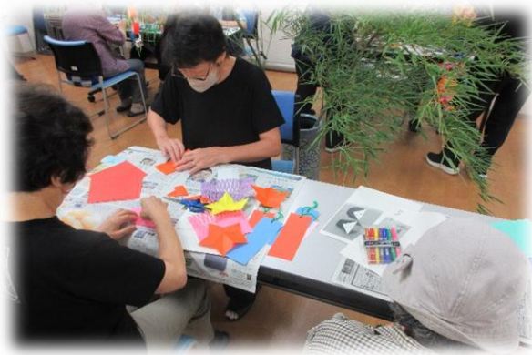
▲七夕飾りを作っている様子

飾りづくりの後は、安城七夕音頭を踊りました。参加者、活動者、職員で和気あいあいとした雰囲気を楽しみながら季節の風物詩を感じました。参加された方からは「飾りづくりも踊りも楽しかった」「みんなとお話できるのが好きで、次回も楽しみ」といった感想がありました。