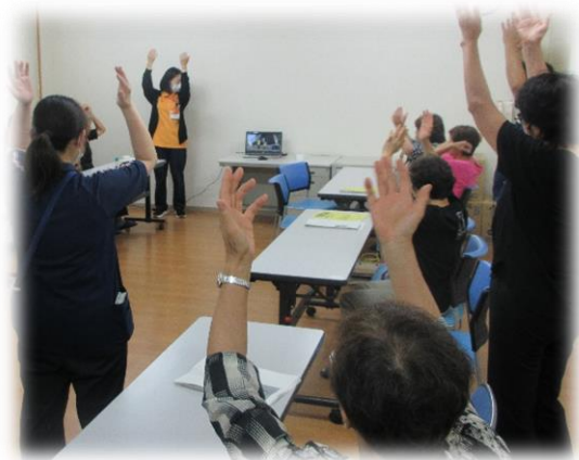
▲安城七夕音頭を踊っている様子

7月12日に介護老人保健施設で実施されたあんきカフェで、七夕飾りづくりが行われました。ご協力いただいている活動者が用意してくださった竹に、参加者のみなさんが折り紙で作った星や、願い事を書いた短冊を飾りました。参加者のみなさんが活動者や職員と会話を楽しみながら制作をされる様子が見られました。