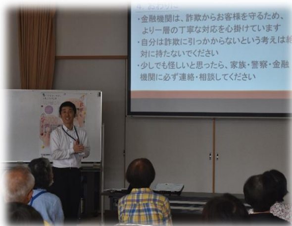
▲碧海信用金庫様による講話

里地区コミュニティセンターでは、6月25日の町内健康体操後に、碧海信用金庫様による特殊詐欺についての講話が行われました。7月からの新紙幣発行のタイミングを狙った詐欺行為への注意事項や、オレオレ詐欺や預貯金詐欺などについての事例紹介と対策方法などのお話がされました。聴講者のみなさんは時折メモを取りながら積極的にお話を聞かれている様子でした。