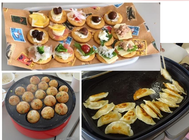
▲ででむしハウスにて手作りしたおやつ (残念ですが、コロナ下のためおやつは持ち帰りです)