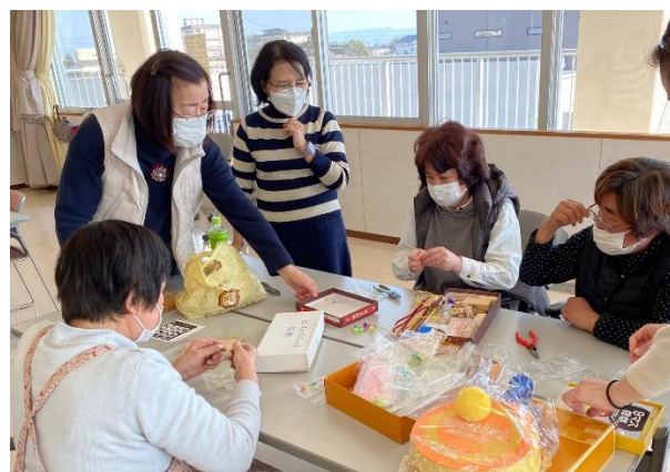
▲子どもたちの遊び相手になったり、おやつ作りをサポートしてくれるボランティアのみなさま

東山地区社協では、作野地区社協、中部地区社協と共催で、 不登校や学校が苦手な子の居場所(ででむしハウス) と、 その親同士の交流会(サロン・ド・ででむし) を毎月第4土曜日(14時~16時)に開催しています。会場は中部福祉センターです。サロン・ド・ででむしは、同じ経験をもつ親同士が語り合う場です。ふらりと出かけて一緒にゆっくり考える機会にしてみませんか？