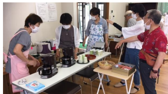
▲飲み物はコーヒー、紅茶、緑茶を用意

茶話会の実施が数年ぶりということで、石橋公民館内の倉庫から備品を探し出し、コーヒーメーカーやお盆、やかん等の必要物品を揃えるところから始まりました。備品の使い方や当日の活動者や参加者の動線等を全員で共有するために、活動者のみでのプレオープンも2回実施しました。