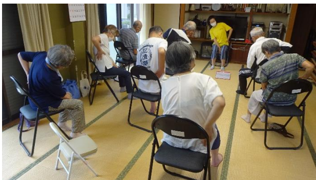
▲健康体操で体も動かすよ♪

後半は、健康づくりリーダーさんによる健康体操を行ってもらい、参加者は体も心もリフレッシュさせていました。