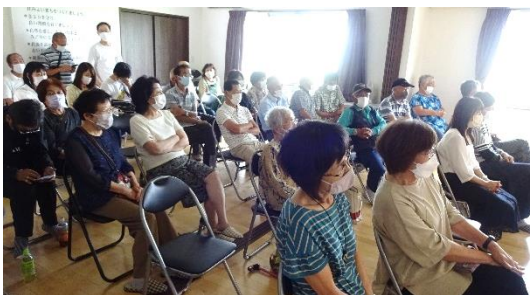
▲出演するアーティストの演奏に聴き 入る地域住民のみなさま

尾崎町では、町内会長に音楽活動を行っている町内住民から「アマチュアバンドが演奏できる場所がどこかないか？」といった相談がありました。