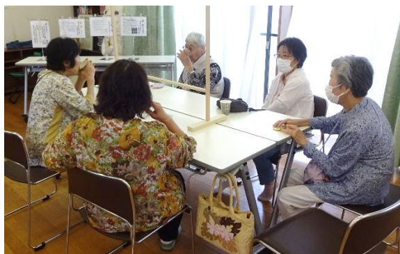
▲コーヒーを飲みながら久々に会う仲間と会話

飲み物やお菓子のほか、来場された方々が退屈せず過ごせるように、ちぎり絵やボーリング、すごろくゲーム、ランプも用意しました。各テーブルでは、ゲームをしたり、おしゃべりに花を咲かせたり、思い思いの過ごし方でサロンを楽しんでいました。