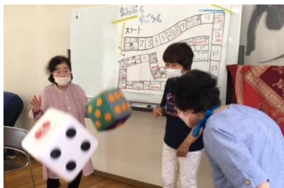
▲すごろくゲームもしたよ