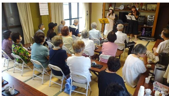
▲講師を招き、うたとバイオリン演奏

町内会長の挨拶で始まり、今回は地元の講師をお招きし、うたとバイオリンの演奏を披露していただきました。