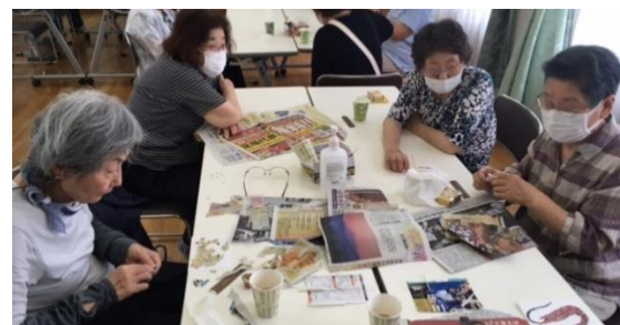
▲地元新聞店の協力で、新聞紙を使ったちぎり絵にも挑戦！

参加者からは、「待っていました」「初めて公民館に来たが楽しかった」「数年ぶりに顔を合わせる人もいて嬉しい」等の声が挙がり、終始和気あいあいとした雰囲気でも過ごされていました。