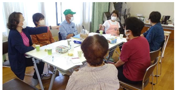
▲新規開催に向け話し合いを重ねた準備委員会