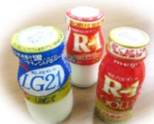
▲参加者にはお土産に(株)明治の自社製品プレゼント♪