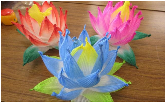
▲参加者が作った作品