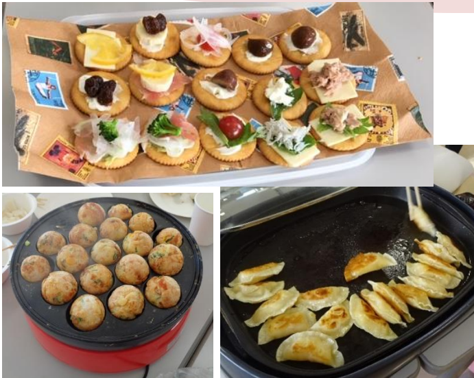
▲ででむしハウスにて手作りしたおやつ その場で飲食できます♪