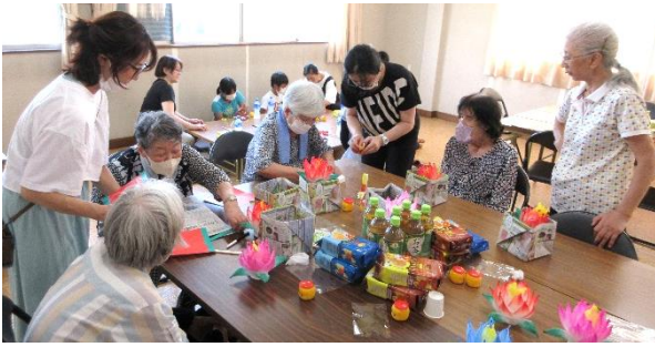
▲町内の子どもから高齢者まで参加