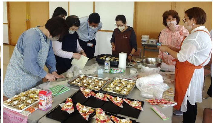
▲子どもたちの遊び相手になったり、 おやつ作りをサポートしてくれる ボランティアのみなさま

東山地区社協では、作野地区社協、中部地区社協と共催で、 不登校や学校が苦手な子の居場所 (ででむしハウス) と、 その親同士の交流会 (サロン・ド・ででむし) を概ね毎月第4土曜日 (14時~16時) に開催しています。会場は中部福祉センターです。サロン・ド・ででむしは、同じ経験をもつ親同士が語り合う場です。ふらりと出かけて一緒にゆっくり考える機会にしてみませんか？