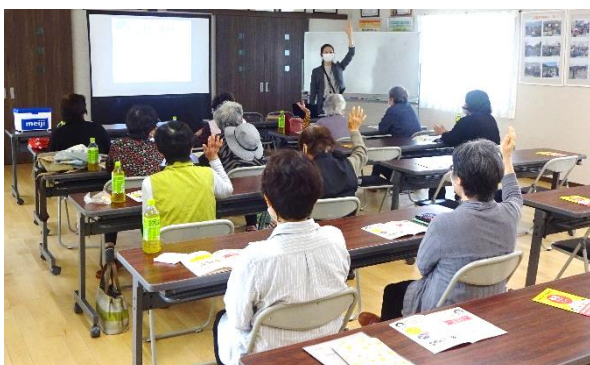
▲サロンにて栄養とフレイル予防の講話（浜屋）

石橋福祉委員会では、茶話会型サロンを月2回開催していますが、「目新しいことも取り入れたい！」という活動者の想いから、茶話会会場の隣の部屋にて(株)明治のご協力のもと骨強度測定を実施。AからEまでの判定結果がその場で分かるため、その結果を見てみなさん大盛り上がりしていました。