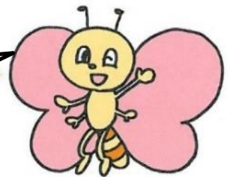
安城市社協キャラクター ハートン