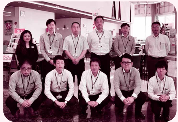
▲名古屋トヨペット(株)三河安城店のみなさま