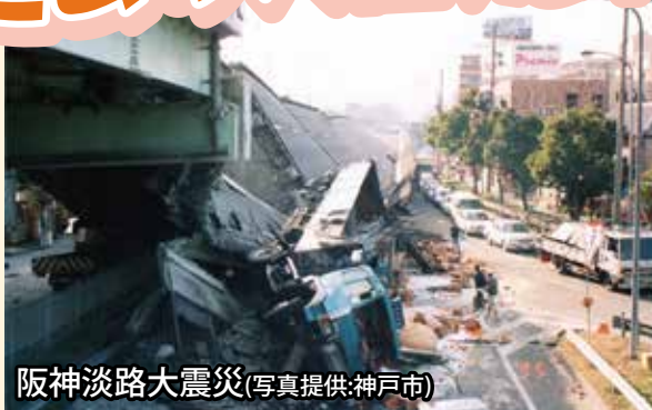
阪神淡路大震災