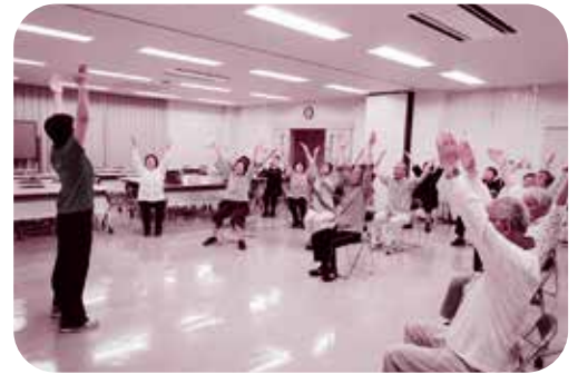
講師の健康づくりリーダーと「町内健康体操教室」の参加者

あなたの地域でも、体操教室を始めたり、身体を動かす機会を増やして、介護予防に取り組みましょう！