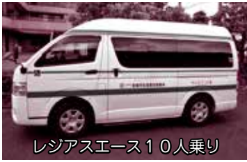
レジアスエース10人乗り