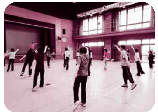
「すっきり・しゃっきり健康教室」の様子