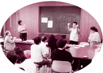
手話サークルでの活動

それでもっと手話をやりたいと感じて講座をもつ一度受けてボランティア活動を始めたの。