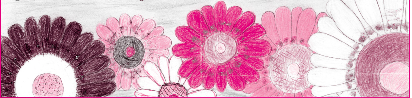
さくら日本語の会 日本語を教えています!