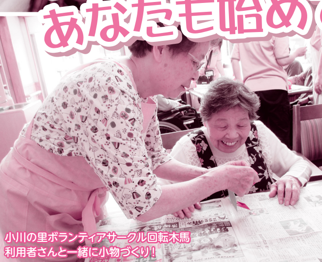
小川の里ボランティアサークル回転木馬 利用者さんと一緒に小物づくり!