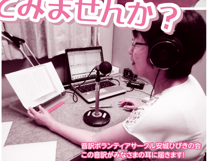
音訳ボランティアサークル安城ひびきの会 この音訳がみなさまの耳に届きます!

仕事を引退した後の人生の過ごし方はたくさんあります。例えば、家でテレビを観る、趣味を楽しむ、地域の集まりに参加するなど、人によって様々です。その過ごし方の1つとして「ボランティア」も加えてみませんか? やりたいことができるようになった今こそボランティアを始める絶好のタイミングです!