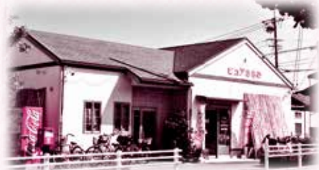
ピュアささめの外観

地域に愛されているこの店の役割は大きく、ひとり暮らしの人が気楽に立ち寄り、自分の目で見て商品を選んだり、カウンターで厨房の人とお話しながら、家族と食事をしているような、ホッとした気持ちも味わうことができます。