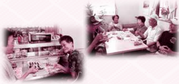
モーニングサービスを楽しんだり、お昼のおかずを選ぶ人も

喫茶コーナーでは、モーニングサービスやランチサービスもあり、店内には明るい会話が飛びかっています。