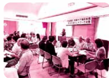
地域ケア地区会議の様子

高齢者に関する総合的な相談窓口、介護予防ケアプランの作成、認知症高齢者への支援、地域のケアマネジャーへの支援、高齢者虐待の早期発見や防止への対応、高齢者の権利を守ること、地域ケアシステムの推進 など