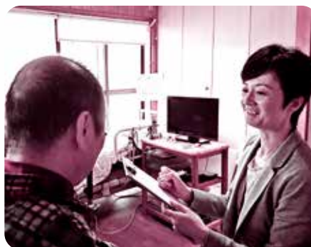
訪問先での相談の様子

要介護1～5の人のケアプラン作成、サービス事業所との連絡調整、介護保険施設の紹介、介護保険制度に関する全般の相談など