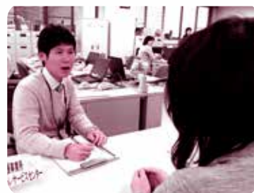
窓口での相談の様子

障がい福祉サービスの利用に関すること、専門機関の紹介、障がいのある人の権利を守ることや虐待防止への援助、基幹相談支援センターとして地域の相談事業所のサポート など