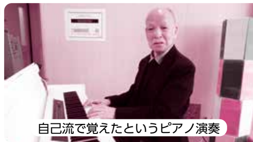
自己流で覚えたというピアノ演奏

昔から音楽が好きで、ピアノは高校生の時に盲学校で毎日練習したんだ。目にくっつけるくらい楽譜を近づけて読んで、自己流で覚えたんだよ。