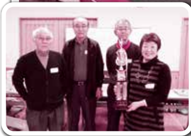
◀優勝した箕輪クラブBチーム。おめでとうございます。