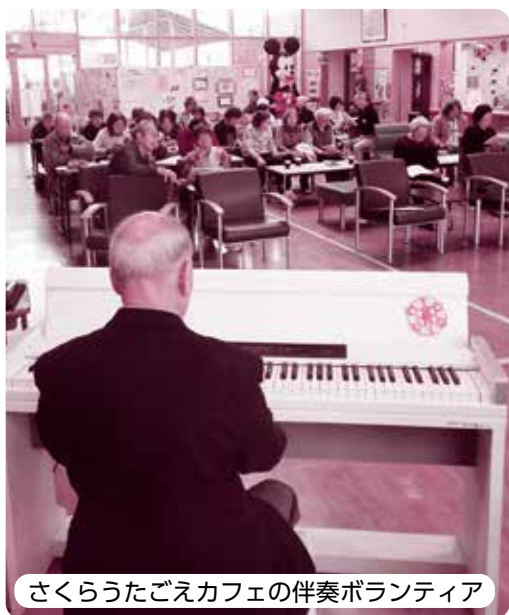
さくらうたごえカフェの伴奏ボランティア