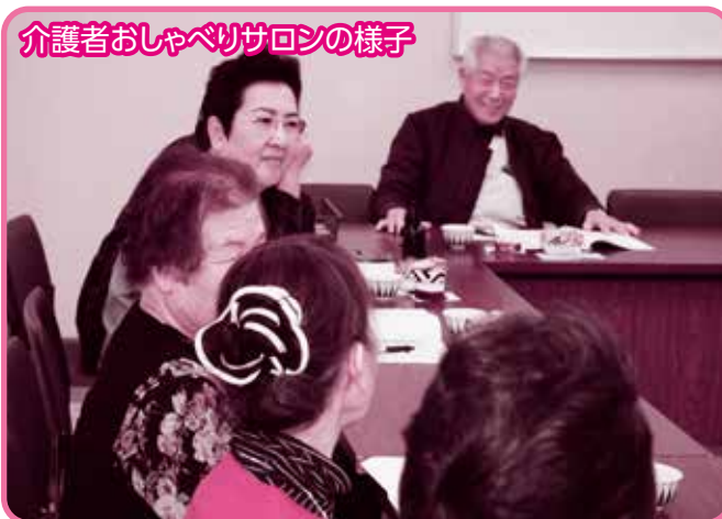
介護者おしゃべりサロンの様子

介護をしている人たちが集まって、 語らいや勉強会、小物作りなど、いろんな ことをやっているんだね。 2・3ページも見てみよう!