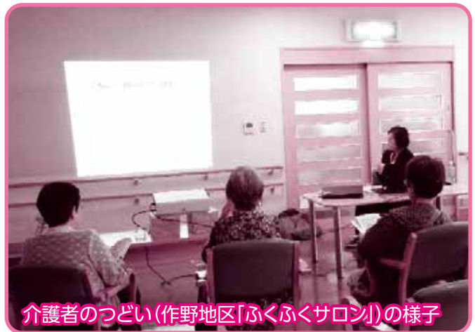
介護者のつどい(作野地区「ふくふくサロン」の様子)