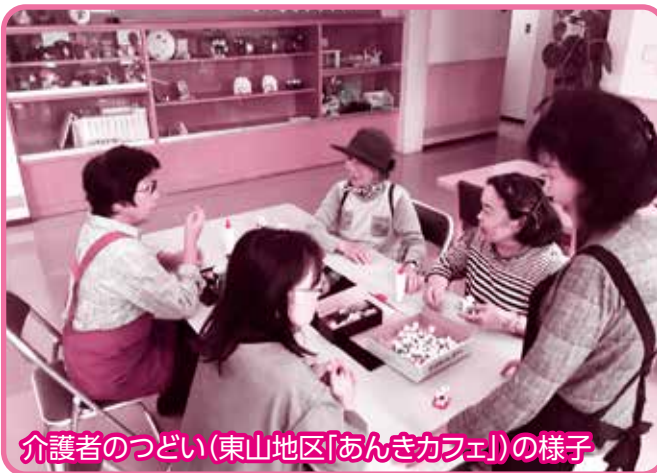
介護者のつどい(東山地区「あんきカフェ」の様子)