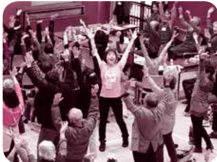
笑いヨガ体験のようす

日 期間・日時 場 場所 内 内容 講 講師・指導 対 対象・資格 定 定員・募集人数 費 費用・受講料等 持 持ち物 申 申込方法等 問 問い合わせ先 他 その他 ※「対」どなたでも 定 特になし 費 無料の場合には記載を省略