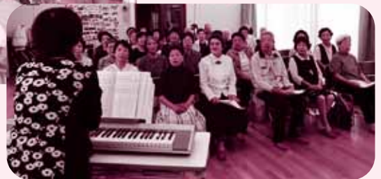
▲うたごえ喫茶 (石橋)

筋トレや脳トレ等による「心身機能」の改善、料理、洗濯、散歩等の「活動」の向上、孫の世話、趣味やボランティア団体への加入、町内会行事への出席等の「参加」の促進を通して生きがいや自己実現に取り組むことが介護予防につながります。