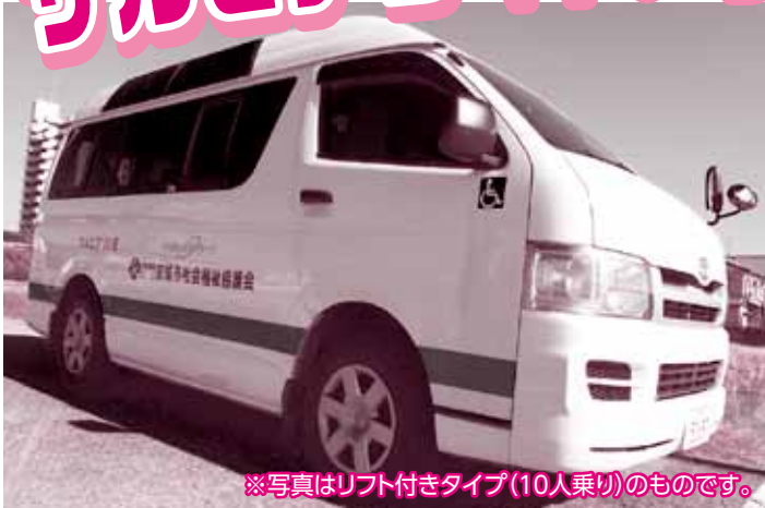
※写真はリフト付きタイプ(10人乗り)のものです。