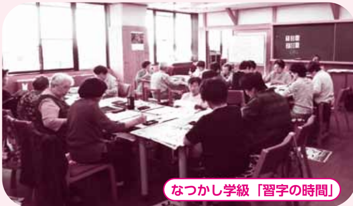
なつかし学級「習字の時間」

また、授業や行事がないときは、自由におしゃべりをしたり、塗り絵をしたりできるよう教室を開放しています。