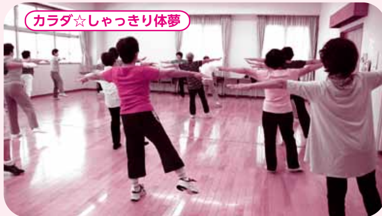
カラダ☆しゃっきり体夢

どちらの体操教室も所要時間は1時間程度で、事前申し込み不要です。お気軽にご参加ください。開催日時は、市内各福祉センターで配布するチラシをご覧ください。か、介護予防担当（77）78888までお問い合わせください。