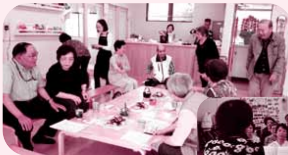
▲ふれあいサロン子宝 (今池町)

介護予防に関する勉強会やサロン活動を実施する町内福祉委員会も増えていきますので、積極的に利用しましょう。町内会や老人クラブの活動等に参加することもお勧めです。