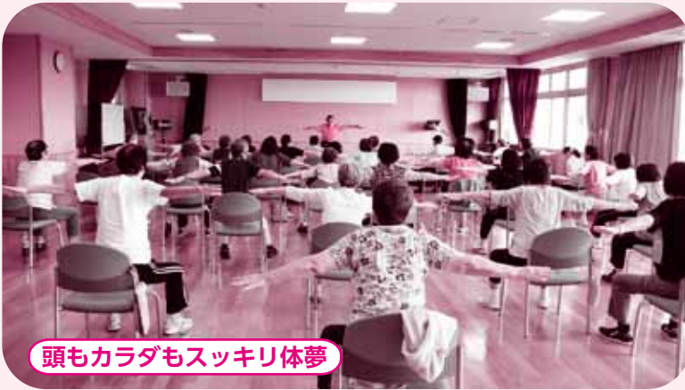
頭もカラダもスッキリ体夢

椅子に座りながら行います。軽度な体操が中心なので、体力に自信がない人でも参加できます。