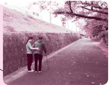
▲買い物に行くための練習