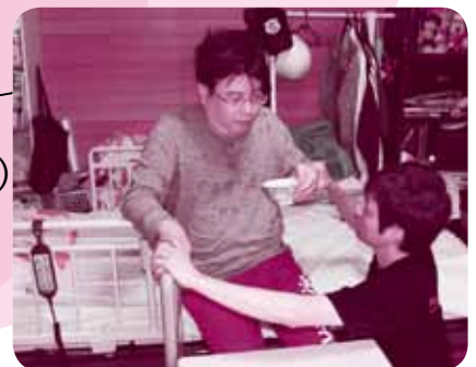
▲茶わんの持ち運び練習