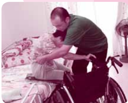
▲車いすへの移乗練習