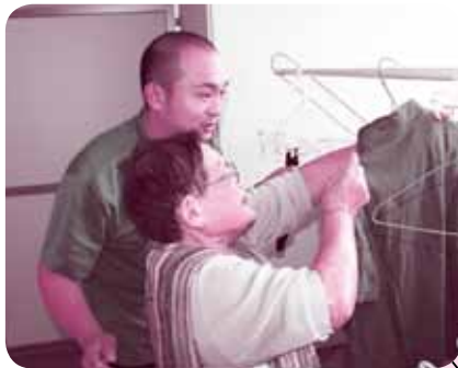
▲洗濯物を干す練習