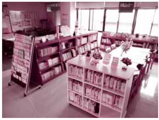
▲社会福祉会館2階の中根文庫