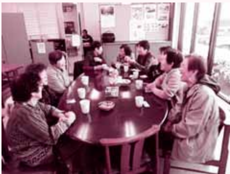
▲毎週土曜日のふれあいサロン

で来たため事情を聞くと、「呼びに行ったが起き上がれないと言われた」ということがありました。ひとり暮らし高齢者だったため、福祉委員が自宅に訪問したところ、体調を崩してしばらく寝込んでいるということがわかりました。すぐに地域包括支援センターなどの専門機関につなぎ、本人同席で今後のことを話し合う会議を開くことができました。今後も住み慣れた自宅で安心して過ごせるように、地域で支え合うためのそれぞれの役割を話し合うことができました。 毎月行われる福祉委員会の定例会議でも、要援護者や最近気になる人の現況を確認し合っています。