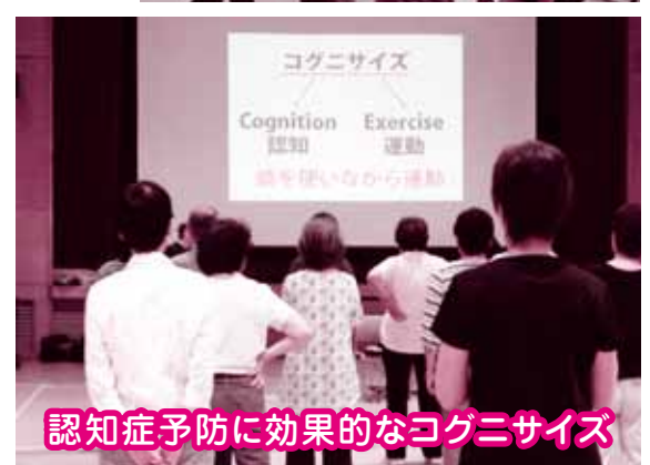
認知症予防に効果的なコグニサイズ