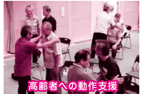
高齢者への動作支援