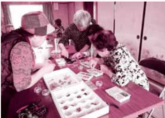
▲小物作りに取り組む