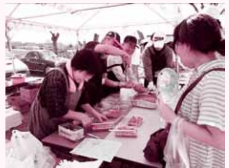
▲福祉施設でのボランティア活動

赤松町福祉委員会は、町内会の行事の参加、地元の福祉施設でのイベントの手伝い、小学生の登下校時の見守り、要援護者の見守りやゴミ出し等の生活支援、サロン活動等を行っています。