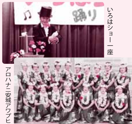
アロハニ安城アワビ