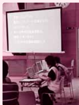
イベントでの要約筆記