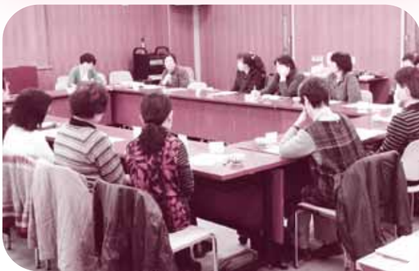
介護者おしゃべりサロン

大変な経験乗り越えた者同士、かけがえない介護体験を活かせる場の一つとしてサロンに来て、運営のボランティアをしませんか？