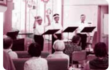
桜井福祉センターの▶ ホールスペース 来館者も一緒に楽しもう♪