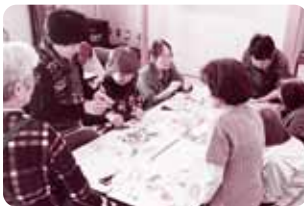
あさりのストラップづくりの様子