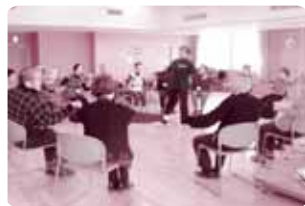
福祉ダンスの様子