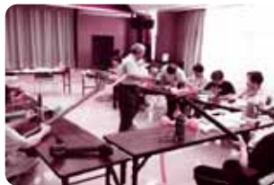
パルーンアートの様子