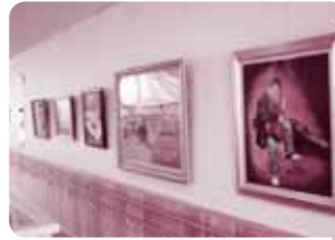
◀安祥福祉センターの ギャラリースペース