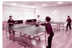
卓球を楽しむ様子