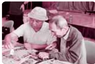
竹鉄砲づくりの様子