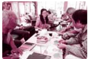
折り紙やめりえの様子