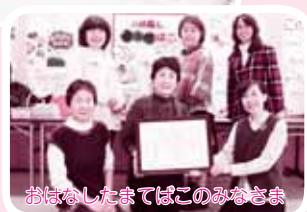
おはなしたまてばこのみなさま