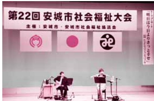
「明日は今日よりきっと幸せ」をテーマに、心温まるお話と演奏を披露していただきました。