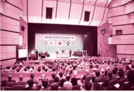
多くのみなさまにご来場いただきました。