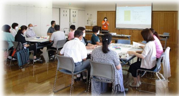
▲「チームオレンジあんじょう」交流会