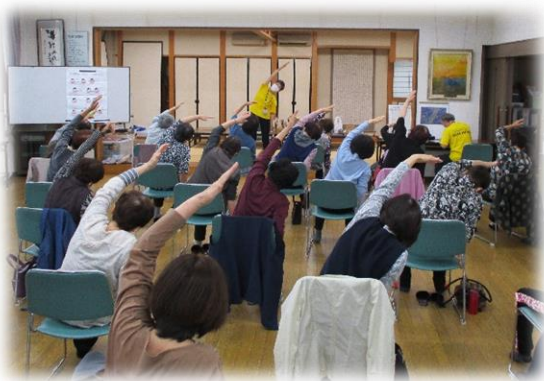
▲ 赤松町内会 健康体操の様子