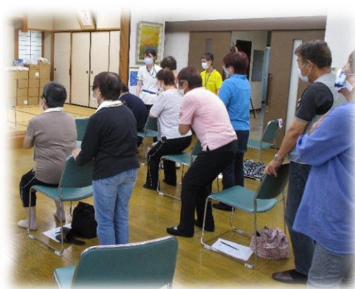
▲ 30秒椅子立ち上がりテスト中 「何回できるかな…」(赤松町内会)