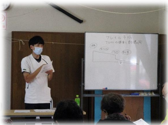
▲ 理学療法士さんによる説明 (南町町内会)

地域リハビリテーション活動支援事業は、リハビリ専門職が地域に関わることで、元気で自立して日常生活を送ることができる健康寿命を延ばすことを目的としています。そのために、今の自分の状態を知って、それを数値化し、今の予防の方法でよいのかを確認していくことをお手伝いしています。