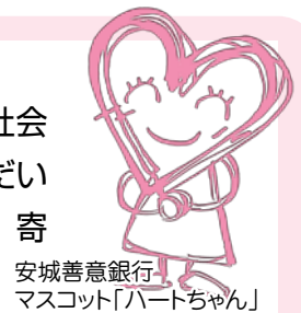
安城善意銀行 マスコット「ハートちゃん」

「安城善意銀行」では、ハート募金への寄付をお願いしています。募金箱は社会福祉会館、市内の福祉センター窓口のほかに市内公共施設およびご協力いただいたお店に設置しています。また、お金以外にも収集物の寄付を受け付けており、寄付していただいたお金同様にさまざまな福祉事業に役立てています。